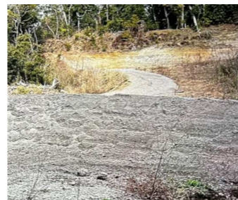
切り開かれていた山林

産業廃棄物の不法投棄なので、県と市が連携して指導し、令和7年5月に赤道から瓦チップを剥がさせました。しかし、隣接地に堆積していたので、事業者が現在も瓦チップを搬出・処理しています。県が毎週立入検査と指導をしていると聞