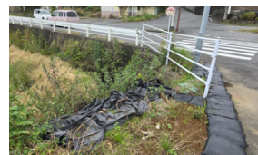
六田台入り口の崩れた路肩の補修。