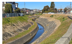
鹿島川の川底の土砂を除去。