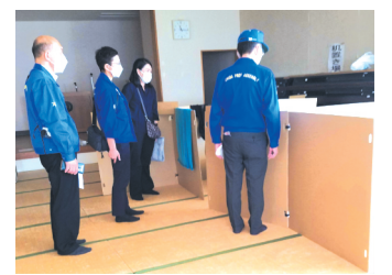
共産党の県議と、水害の時の避難所を調査。