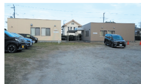
東部小の学童クラブの施設を増築。