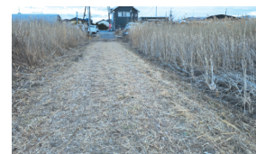
「ねぎぼうず」付近の通行不能だった市道を整備。