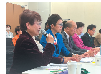
「学校の給食を無料に」と、県議とともに文科省に要求。